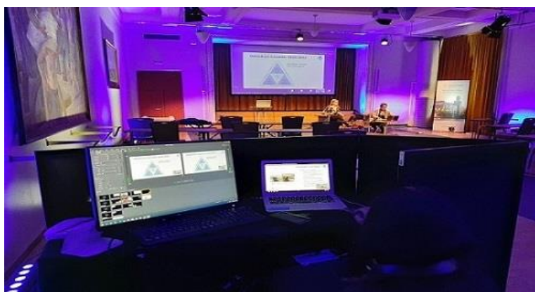
GeroMetron kauden loppuseminaarin striimauksen tunnelmia

Kausi huipentui lokakuussa järjestettyyn päätösseminaariin ja sen jälkeen julkaistuun loppuraporttiin. Uutena toimintatapana kehittämistehtävistä tehtiin videoesittelyt.