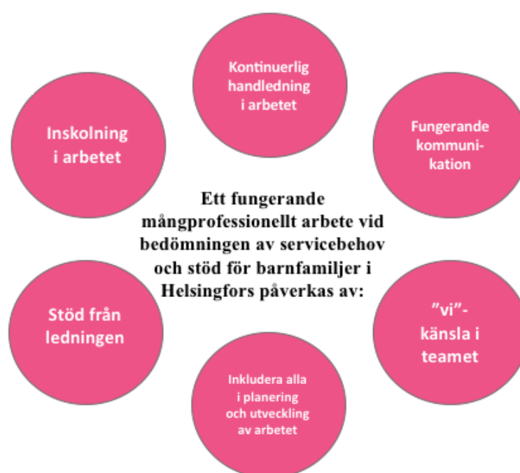
Bild 3. Faktorer som påverkar ett fungerande mångprofessionellt arbete.

Med bilden nedan vill vi konkret beskriva vilka faktorer som gör ett fungerande mångprofessionellt arbete vid bedömningen av servicebehov och stöd för barnfamiljer. Dessa faktorer har lyfts fram av informanterna under intervjuerna.