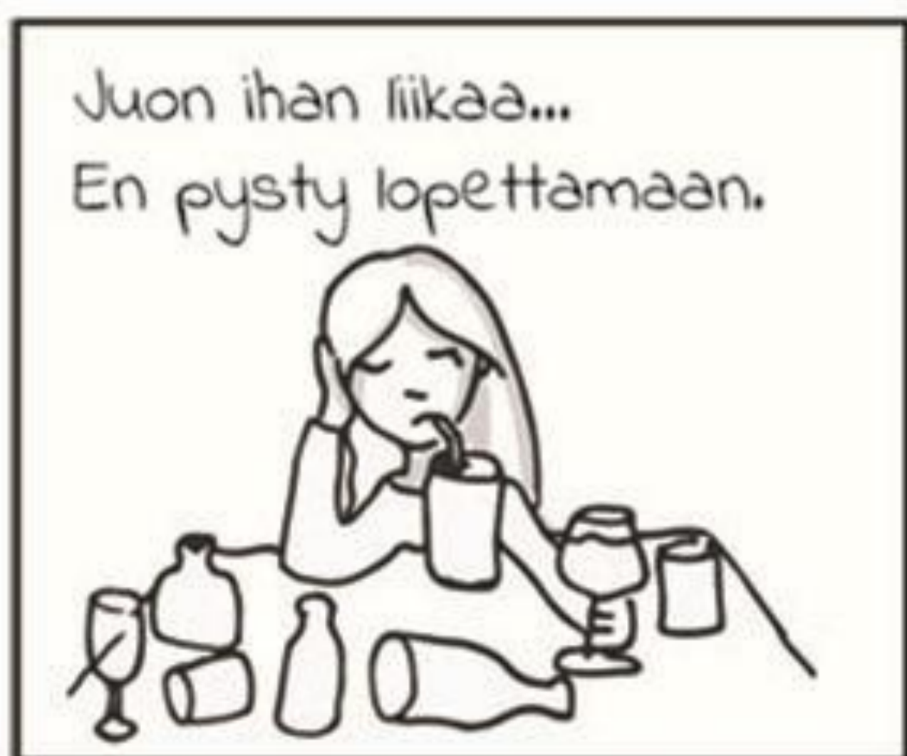
(Asiakas 3) Voi olla myös yksi asiakas, jolla kaikki haasteet.