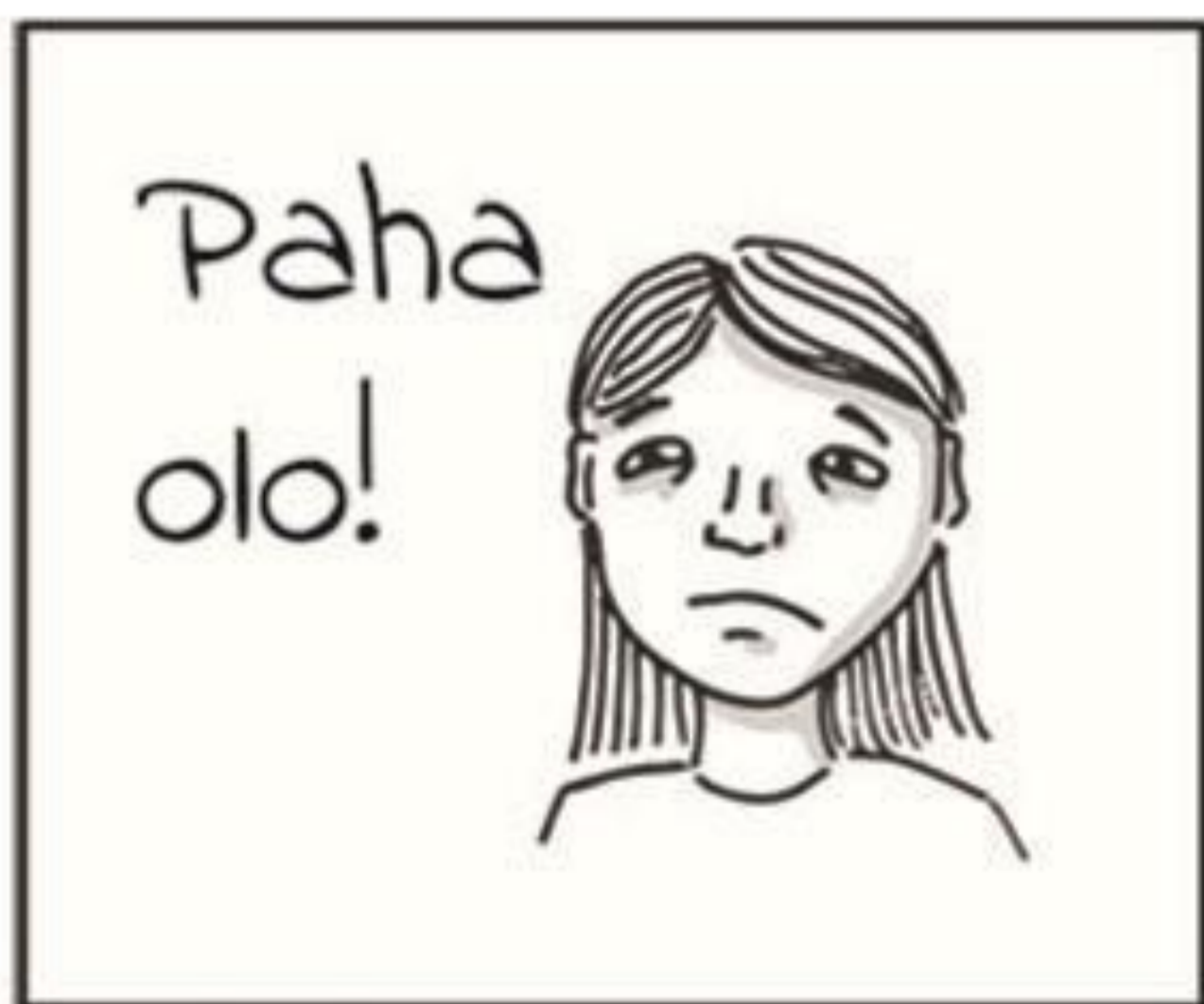
Musiikki hiljaista / dramaattista. Surullinen katse (asiakas 1). Teksti tulee kuvan jälkeen.