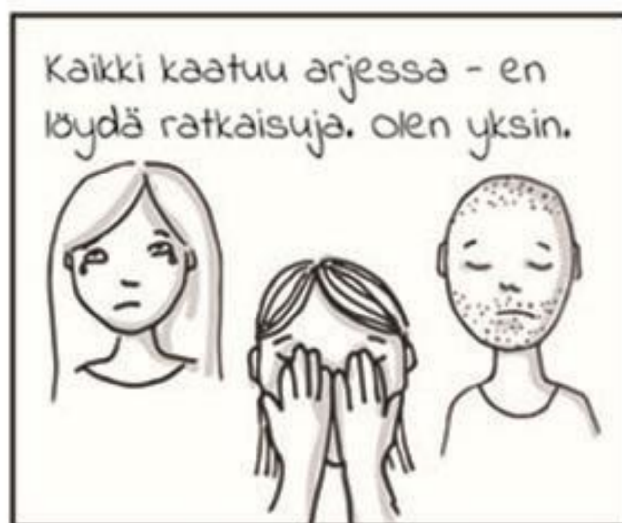
Ongelmat tulevat ilmi lähinnä pienillä eleillä ja ilmeillä.