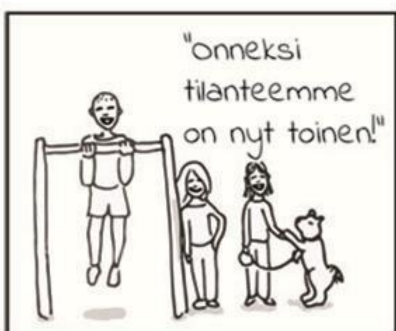
Positiivinen musiikki. Lopussa asiakkaat yhdessä esim. ulkona "voimassa hyvin" "jotakin on tapahtunut".