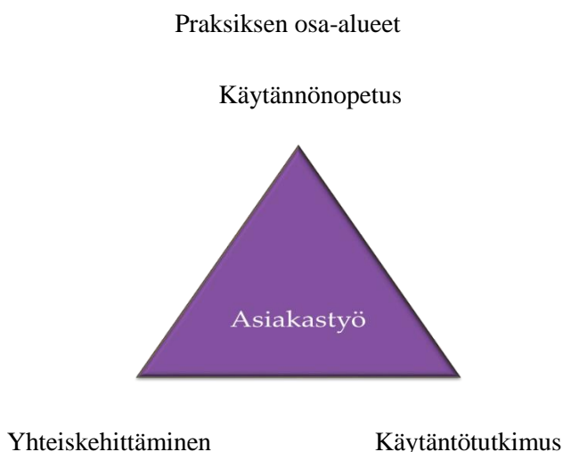
Kuvio 2. Praksiksessa yhdistyvät sosiaalityön käytännönopetus, tutkimus, asiakastyö ja kehittäminen

Pääkaupunkiseudun Praksis on Helsingin yliopiston ja pääkaupunkiseudun kuntien yhteistä toimintaa asiakastyön käytäntöjä kehittäväälle sosiaalialan käytäntötutkimukselle ja -opetukselle. Se mahdollistaa yliopiston, kaupunkien ja kolmannen sektorin välisen yhteistyön ja vuorovaikutuksen. Tavoitteena on rakentaa ja ylläpitää pääkaupunkiseudun sosiaalialan asiantuntijaosaamista ja uudistaa sen tietoperustaa käytännöistä käsin. (Heikki Waris -instituutti 2014.) Praksis ei siten ole vain käytännönopetuksen areena. Praksiksen toiminnan ydin on sosiaalityön käytännön opetuksen, tutkimuksen ja kehittämisen liittäminen käytännön sosiaalityöhön sekä edistää pääkaupunkiseudullisia yhteisoppimisen prosesseja (esim. oppimisverkostotoiminta) monien toimijoiden kesken. Praksis-toiminnan tavoite kiteytyy hyvin kuviossa 2.