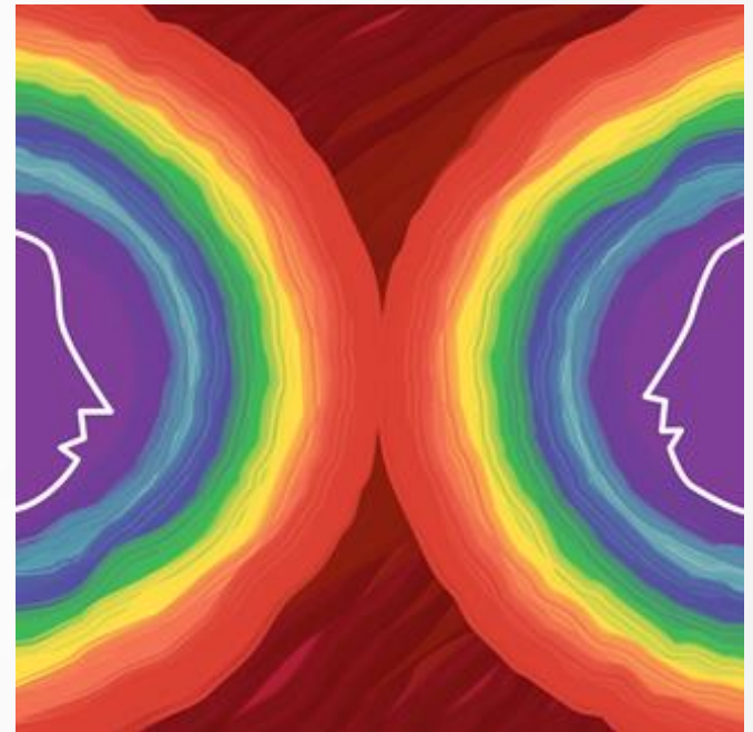
Kuva oocceey Pixabaystä

Koska vähemmistöstressi on aina reaktio syrjintään, paras tapa helpottaa sitä on sitoutua syrjinnänvastaiseen ja antirasistiseen työotteeseen ja vuorovaikutukseen